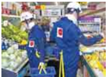
Op stap met het pak.

pak werd Agnes genoemd, een afkorting van Age Gain Now Empathy System . Het idee ontsproot uit Puleo's ervaringen als klinisch bewegingsfysioloog met het 'obesitaspak' en het 'zwangerschapspak', die bedoeld zijn om de dragers te laten ervaren hoe het is om veel overgewicht te hebben of zwanger te zijn. Het bejaardenpak beperkt de bewegingsvrijheid van vrijwel alle gewrichten in het lichaam. Sommige bewegingen zijn daardoor onmogelijk geworden terwijl andere bewegingen veel meer inspanning vergen. De enige ouderdomskwaal die niet gesimuleerd wordt, vinden de onderzoekers, is geheugenachteruitgang.